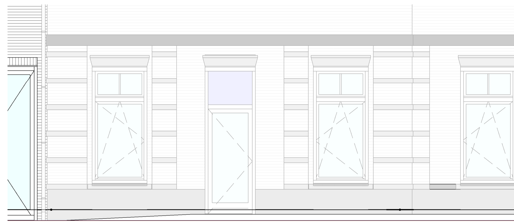
Voorgevel bouwnummer 01